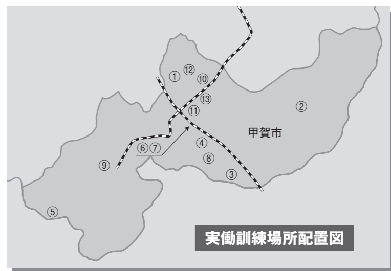
実働訓練場所配置図

平成19年9月2日午前7時に大規模地震が発生し、甲賀地域で震度7を観測したと想定し、総合防災訓練を行います。