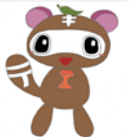
甲賀市教育支援センター マスコットキャラクター 「てき丸くん」

学校や家庭とは異なる 安心・安全な環境で、 いろいろな活動や体験を通して 子どもたちが自信や生きる力をつけ、 新しい一歩を踏み出すエネルギーを 蓄えていくところです。