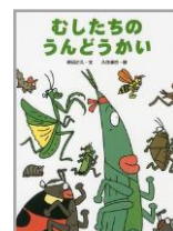
むしたち シリーズ