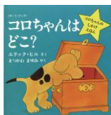
初めての しかけ絵本