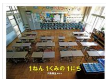
小学1年生の生活 を写真で紹介