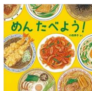
おいしそうな絵本