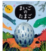
恐竜が出てくる 絵本