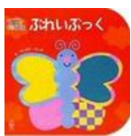
触って楽しむ 絵本

絵本は心の栄養ともいいます。お子さんに無理強いする必要はありませんが、関心が持てる絵本を探してみるのもいいかもしれませんね。今回は年齢や興味に合わせた絵本を紹介します。絵本を選ぶ時の参考にしてみてください。