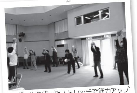
▲ボールを使ったストレッチで筋力アップ