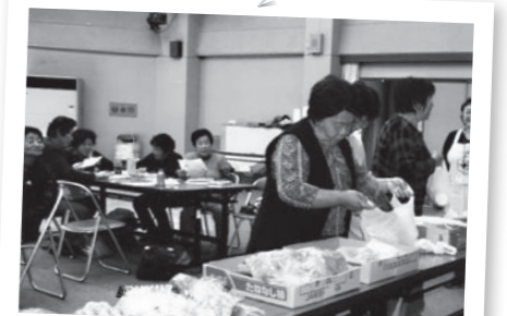
▲1日に必要な量の野菜350グラムを計量

問い合わせ 健康推進連絡協議会事務局(健康推進課) ☎65-0703 ☎63-4591